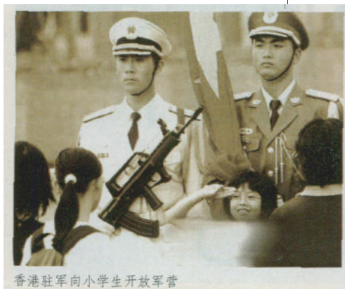
香港驻军向小学生开放军营

军装既展示着军人的仪表,也成国人的象征,体现了军人的相互关系和精神风貌,也在一定程度上反映着国家经济文化发展水平和军队现代化正规化建设水平,是国威、军威的具体标志。它既是构成军队战斗力的重要组成部分,又与广大官兵的生活息息相关。看样式统一、质量优良、穿着舒适的军服,对加强军队纪律,维护军队秩序,展示军队形象,保持军人身体健