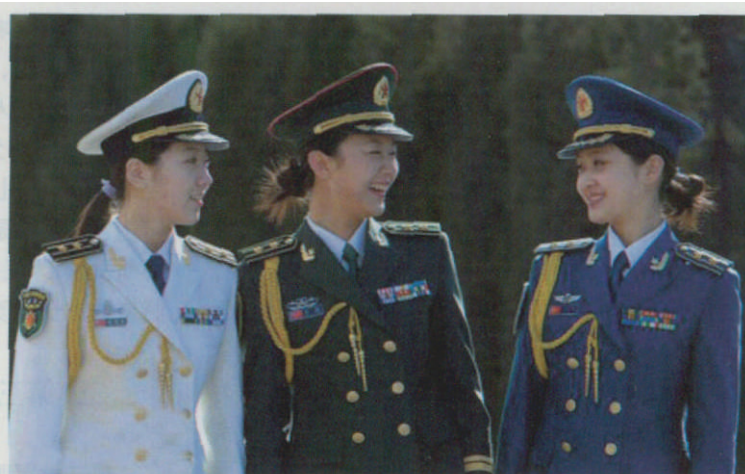
穿着中国人民解放军军服的女兵

军衣 涤纶占50%,锦纶占17%,棉花占33%),1971年优先装备边防和北京卫戍区部队,1973年装备全军。军服颜色也由深棕绿改为草绿色。1978年,冬服罩衣也改用混纺布料,混纺布军服耐磨耐用,穿着挺括平展,重量轻,开辟了提高军服质量的一个重要途径。在这期间,海军的灰色军服由于没批准,海军恢复了1955年的服装样式。