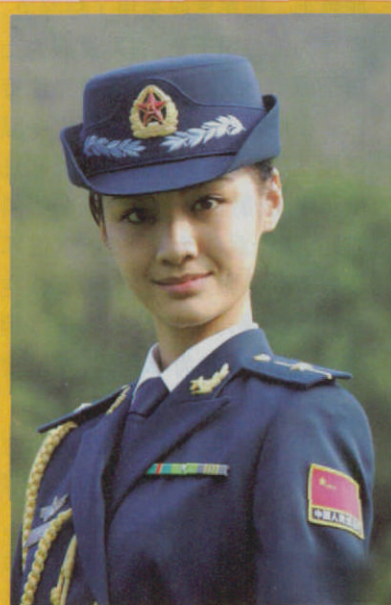
着 07 式礼服的空军女军官

相同,左臂佩带长方形“八路”、“新四军”臂章,服装颜色为草黄色,战士为4个贴袋,干部为两个贴袋、两个吊袋。在抗日战争初期,国民党政府曾给八路军、新四军发放过国民革命军制式服装。1940年,在国民党政府连续掀起三次反共高潮之后,中共中央号召全军“自己动手,丰衣足食”,开展了轰轰烈烈的大生产运动。这期间,军服颜色以灰色为主。解放战争初期,我军的服装样式与抗日战争时期相同。1947年3月,我军正式称为“中国人民解放军”,取消“八路”、“新四军”臂章,各部队分别佩带标有番号的臂章或胸章。军服颜色也不一致,多数是土黄色,中原部队则是灰色。解放战争后期,我军接管了一批国民党军队的军需工厂,从而初步具备了统一生产和供应服装的条件。1949年1月,军委后勤部规定了全军统一的服装样式。军服为草绿色棉平布中山装,胸前佩带长方形布胸章,印有“中国人民解放军”字样,头戴解放帽,帽徽为“八一”红五角星,1949年10月参