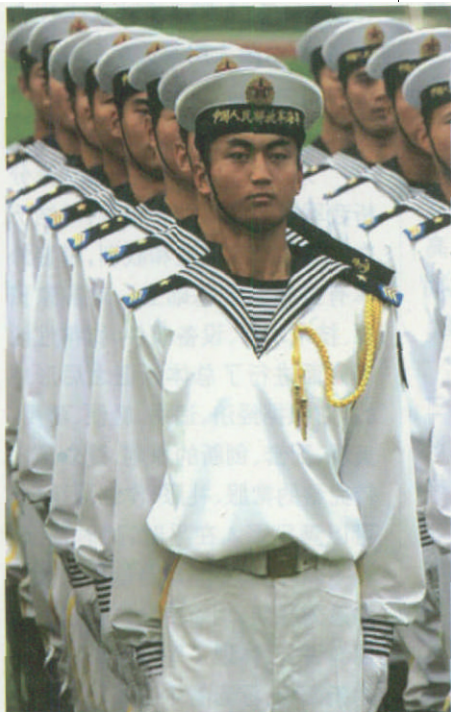
着仪仗队礼服的海军士兵

军官夏常服,陆军为棕绿色,海军为上白下藏青色,空军为上棕绿下藏青色。士官、士兵夏常服:陆军为草绿色,海军为上漂白下藏蓝