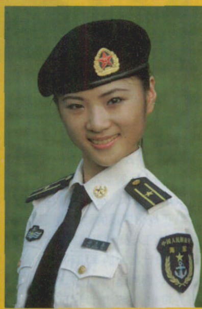
着 07 式夏常服的海军女军官