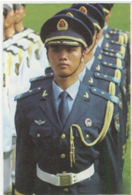
着 07 式仪仗队礼服的空军士兵

和军港呢。还给士兵设计了一双作战靴。二是样式更为美观。礼服是西服式,夏常服是立翻领,可以扎领带,也可以不扎领带,并首次将夹克式和贝雷帽引进了驻港部队服装。三是颜色形成系列。陆军是棕绿色,海军是本白和藏青色,空军是蔚蓝色。在同一色调中基本遵循礼服深,常服浅;冬服深,夏服浅;外衣深,内衣浅的变化规律。四是服饰趋向配套。为弥补87系列服装装饰太少,胸前太空的缺陷,设计了胸标、名牌等服饰。五是军服实现通用。首先是常礼服通用,所有常服配上服饰后都可以作为礼服穿用,提高了服装的使用效率。其次是内外通用,毛(绒)衣等带军衔也可以作外衣穿。再次是官兵通用,像春秋常服、夏常服、作训服等,官兵款式和所用材料都是一样的,可以通用。