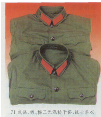
71式涤、锦、棉三元混纺干部、战士单衣

军官夏常服均为小开领,配白衬衣,戴大檐帽。男军官系藏青色领带,制式衬衣为猎装式短袖衫;冬常服式样与“八五”式服装大体相同,下衣改为西服裤。女军官系玫瑰红色领带,制式衬衣为开领、短袖,配有藏蓝色西服裙;冬常服