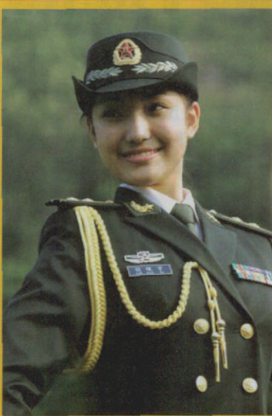
着 07 式礼服的陆军女军官