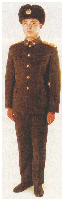
陆军男军官冬常服