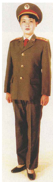
陆军女军官夏常服