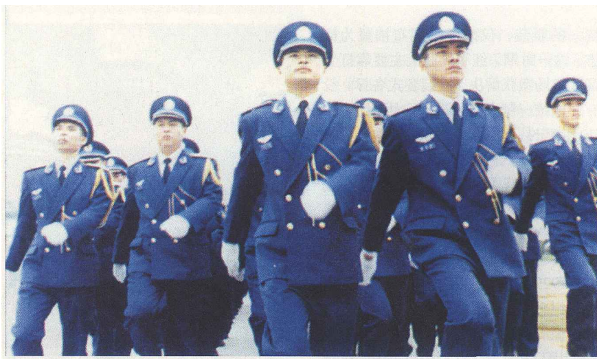
▲ 驻港部队空军军官礼服