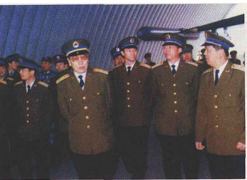
▲空军八七式夏常服

解放战争后期，我军的军需工厂已初具规模，为全军统一服装、统一式样、统一生产、统一供应提供了物质条件，为解放战争的胜利奠定了物质基础。