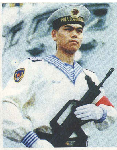
▲驻港部队海军士兵夏常服

1949年，我军军服为草绿色，材料为棉平布，胸前佩带有“中国人民解放军”字样的胸章，帽子改为解放帽，戴“八一”红五星帽徽。