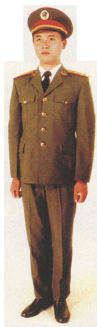
陆军男军官夏常服