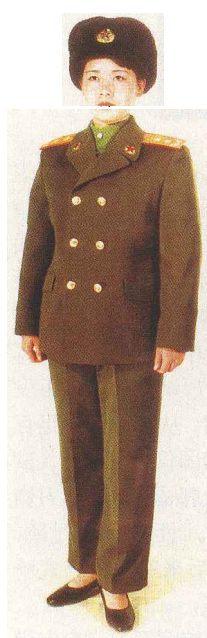
陆军女军官冬常服

1927年，南昌起义的一声枪响，向全世界宣告，中国人民自己的军队诞生了。当时的起义部队身着国民革命军的服装，系红领巾以示区别。同年9月，毛泽东、朱德领导的秋收起义部队，尚无