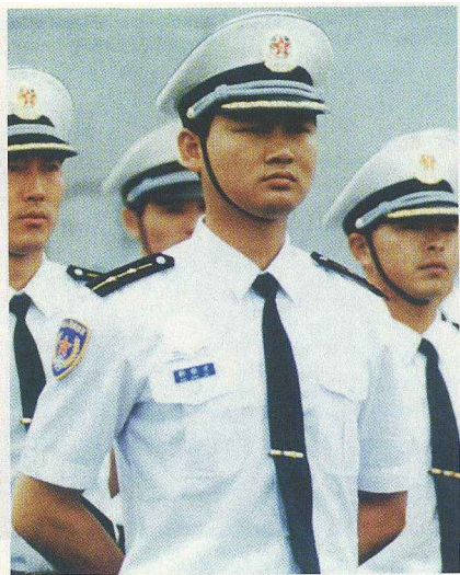
▲驻港部队海军军官夏常服